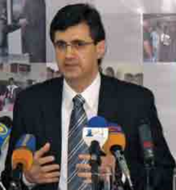
Միգրել ԿԻՄ Միջին Արևելքի Կարիերայի