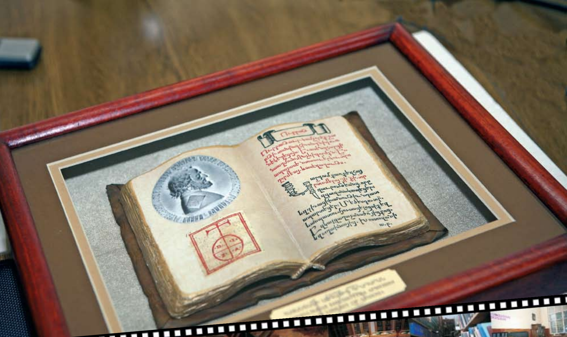
Manuscript of the... ... ... ... ...